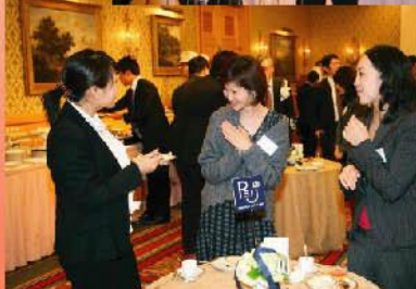
女性誌のご担当者様